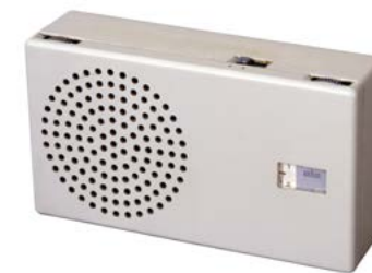
Dieter RAMS (1932, Allemagne) / Radio T4, 1959 / Acrylonitrile butadiène styrène (ABS) Fabricant et éditeur : Braun, Kronberg im Taunus (Allemagne) / Collection MAMC+. © Dieter Rams