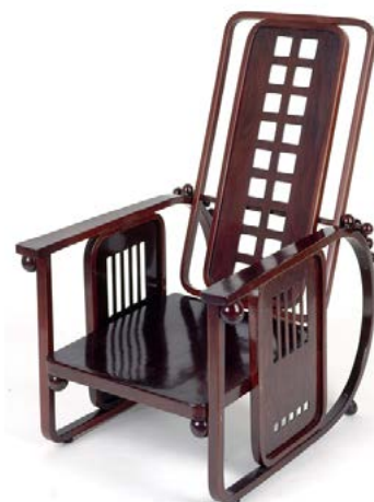
Josef HOFFMANN (1870, Moravie - 1956, Autriche) / Fauteuil Sitzmaschine, 1904 / Fauteuil à dossier inclinable - Hêtre teinté ocajou - 108 x 67 x 82 cm / Collection MAMC+.