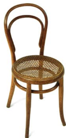
Michael THONET (1796 - 1871, Autriche) / Chaise n°14, 1859 - 1860 / Hêtre massif courbé et assise cannée rotin - 92,5 x 42 x 50 cm / Collection MAMC+.