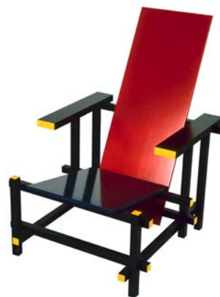
Gerrit T. RIETVELD (1888 - 1964, Pays-Bas) / Fauteuil Red and blue chair, 1918 / Bois peint - 86 x 67 x 67 cm / Collection MAMC+.