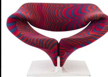
Pierre PAULIN (1927 - 2009, France) / Fauteuil Ribbon chair, 1966 / Armature en tube d'acier, piétement en bois laqué, garniture en mousse latex, revêtement jersey de polyamide (PA) - 70 x 105 x 80 cm / Collection MAMC+.