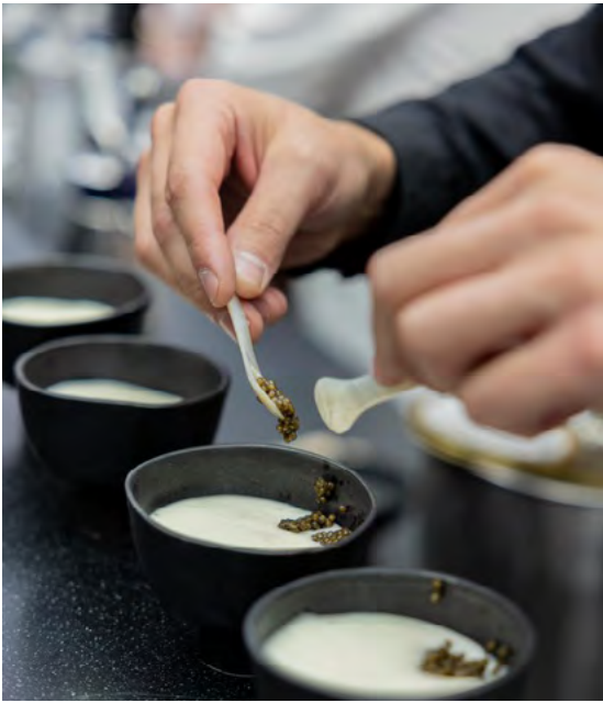
Démonstration culinaire par Marc Bretillot