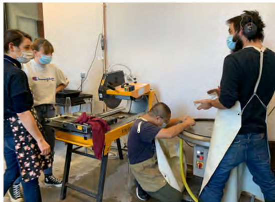
Séance de travail, ateliers du faire, Fondation Martell, IDE TO COGNAC, France

Chacun des pavillons crée une relation plus intime avec le visiteur, à travers une série de témoignages très documentés. Comme autant de fragments des explorations, ici assemblés, ils restituent le contexte, le voyage, les pensées et les idées, les démarches. Ce sont des espaces de rencontre, de curiosité, où la recherche se donne à voir et se transmet.