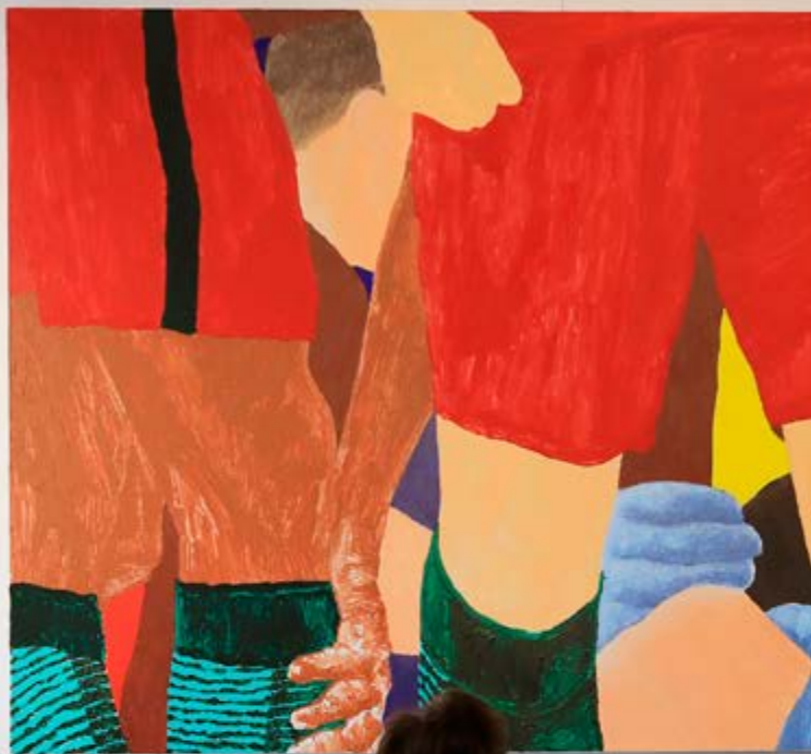
Red & Blue by [unreadable] [unreadable]

ensic itecture [unreadable] [unreadable] [unreadable] [unreadable]